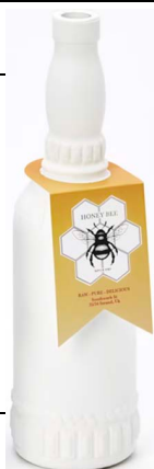
COLLARINO misura 65mm x 160mm

NB: Il costo per la Spedizione dei Cartellini alla Vostra Cantina è compreso nel prezzo di acquisto